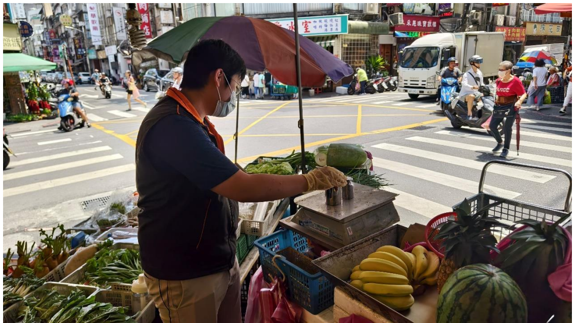
113年8月13日基隆仁愛市場外圍水果零售攤商磅秤(電子秤)檢查