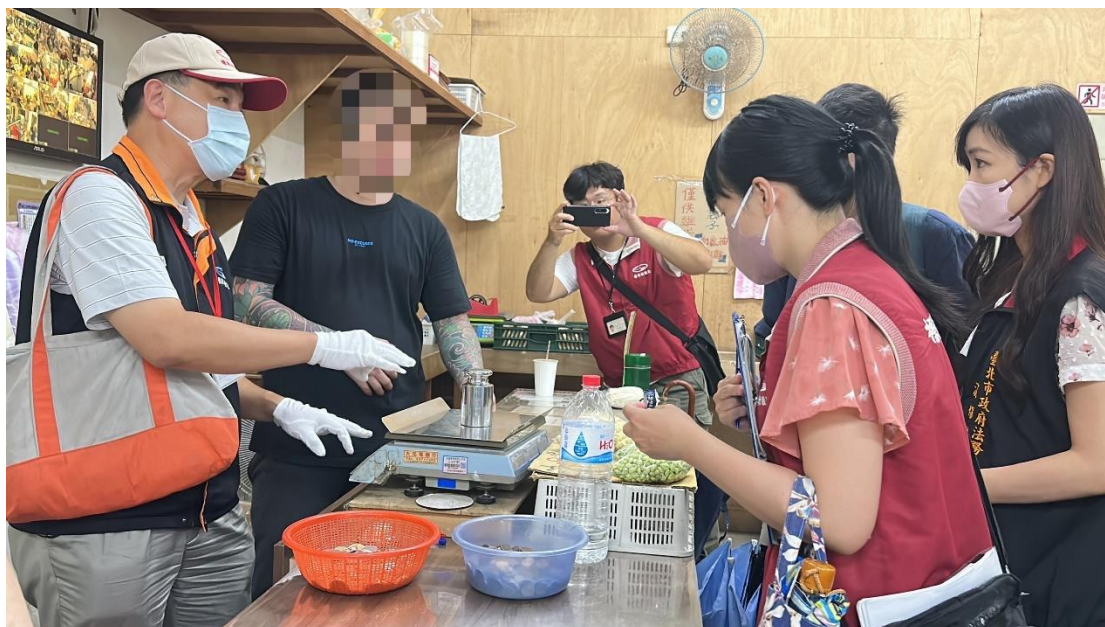
113.07.26 會同臺北市政府消保官於臺北市內湖區 737 市場衡器檢查