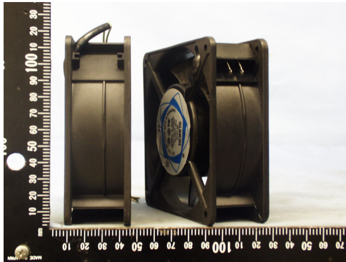
產品照片(無保護網、電源線及插頭)

議題1：有關不帶電源線與保護網之四角風扇，產品照片如下所示，該產品電器分類應為何類結構。是否可列為組裝後評估之商品，驗證標準部分章節依該商品使用說明書安裝後於終端產品再進行評估，來考量使用者的安全性問題，此判定結果是否可行？