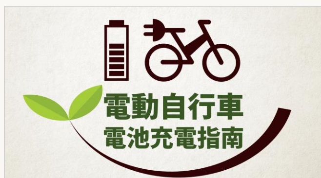
電動自行車電池充電指南