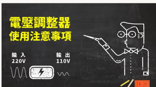
電壓調整器使用注意事項