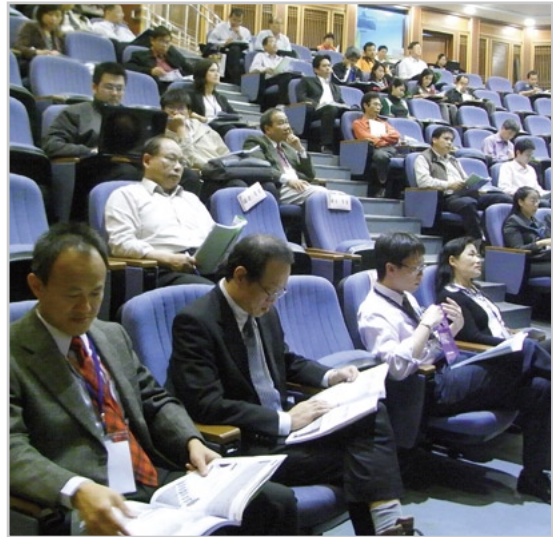
▲ 圖1：彰縣首場「中小企業創新研發輔導聯合說明會」13日於文化局向縣內頭家說明各項政府輔導資源與計畫，吸引百家廠商報名瞭解。

車輛中心黃隆洲總經理指出，各界在此波全球金融海嘯中遭逢前所未有的衝擊與考驗，但機會是留給已經準備好的人，因為身處谷底卻要蹲的更低、伺機沈潛、不斷改造與增值。對於中小企業而言，善用政府研發經費補助方案與申請各項輔導計畫或措施，便是條通往羅馬大道的捷徑，只要掌握契機持續研發與創新，才能在景氣回春邁向成長高峰時跳得比別人更高。