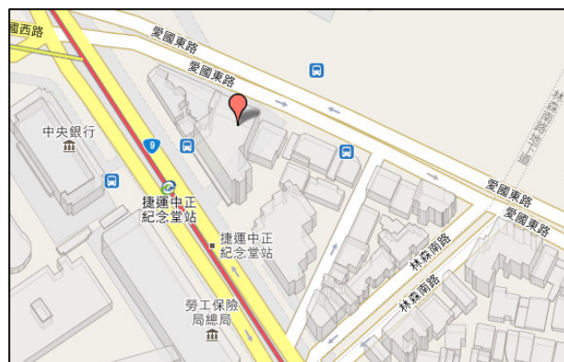
紡拓大樓/第一會議室位置圖