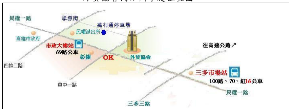
外貿協會高雄辦事處位置圖