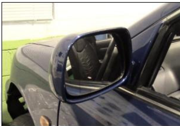
個人化後視鏡實體