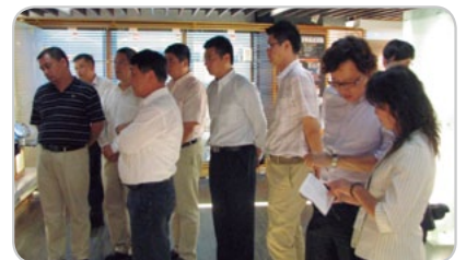
▲ 貴賓於研發展示中心聽取介紹

本次參訪行程重點在於了解車輛中心現階段之研發成果，貴賓們對於本中心先進智慧技術在國外屢創佳績深感敬佩；同時，也試乘中心所開發的i-EV智慧電動車，並對於i-EV整合技術水準，動力輸出等技術成就十分肯定。另外也參訪環測實驗室、疲勞耐久實驗室及試車場等，不時交流實務測試經驗，討論熱烈。雙方皆為車輛測試驗證機構，未來可互相學習交流，建議可先從摩托車、燈光、EMC及電動車之檢測技術開始，進而再擴大對於兩岸車輛產業提供所需之服務。