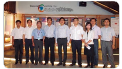
▲ 中國汽車工程研究院參訪車輛中心科研成果