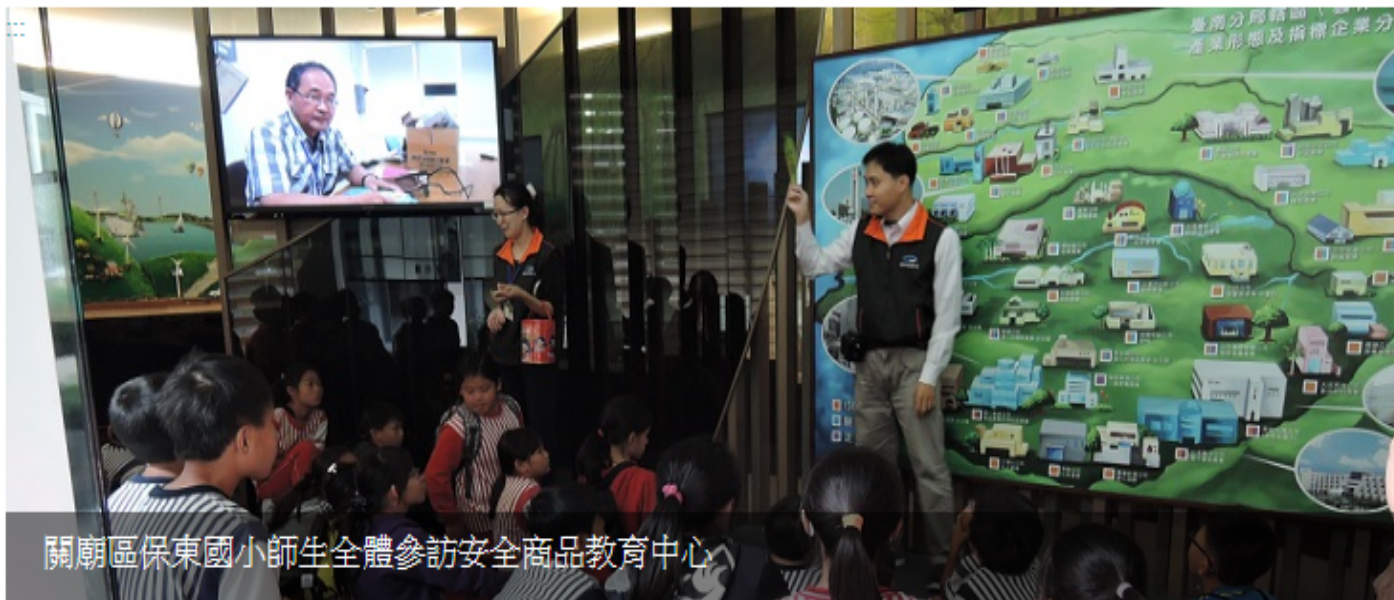
關廟區保東國小師生全體參訪安全商品教育中心